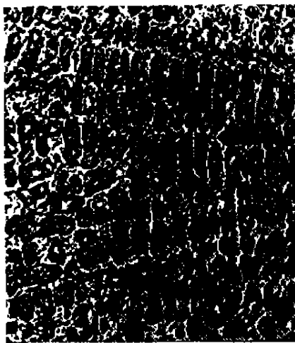
图 1 堆焊合金的金相照片 x400